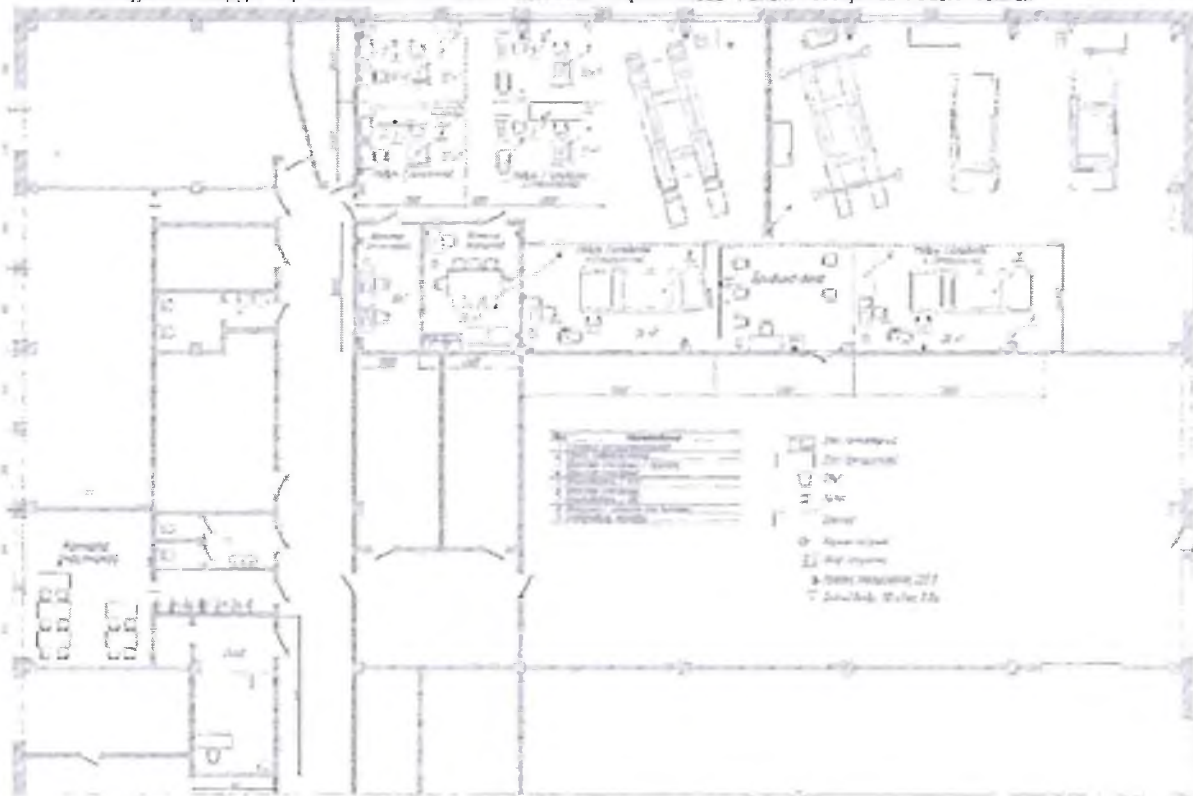
Конкурсная площадка VII регионального чемпионата "Абилимпикс-Кубасс-2022" "Ремонт и обслуживание автомобилей"