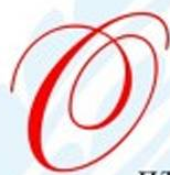
Коллектив ГОУ ДО Областной Дом техники НПО

О птимизма! Удачи и хорошего настроения! Уютной атмосферы в доме, любви и теплоты, уважения и доверия в коллективе, счастливых и радостных дней!