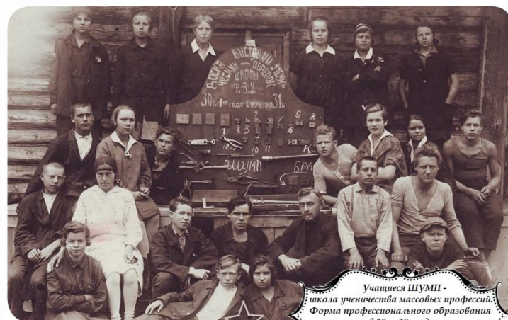
Ученицы ШУМПИ - школа ученичества массовых профессий. Форма профессионального образования 1920-30-е гг.

За 95 лет в учреждении подготовлено более 13 тысяч дипломированных специалистов и более 100 тысяч квалифицированных рабочих для предприятий сельского хозяйства и промышленности, жилищно-коммунального комплекса, строительства и сферы услуг. Техникум по-прежнему – главная кузница кадров для района, предлагающая молодым людям широкий выбор профессий. Почти вековую историю успешно продолжают команда талантливых преподавателей и ежегодно обновляющийся отряд студентов. Вместе они уверенно идут к поставленным целям.