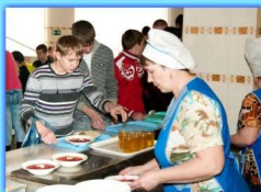
- Столовая -