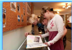
- Музей -