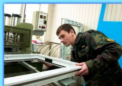
- Цех по изготовлению изделий из ПВХ -

В прошлом году в профессиональном лицее № 21 отремонтированы и оборудованы все учебные кабинеты, два спортивных зала, актовый зал. Проведена компьютеризация лицея, оснащены современными компьютерами три кабинета информатики, что дает возможность учащимся получать дополнительное образование – пользование ПК.