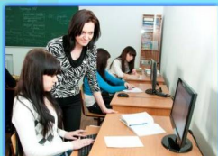
- Урок «Информационное обеспечение гостиничного комплекса» -

В 2010 году на областном конкурсе «Развитие – XXI век» проект «Модернизация учебно-материальной базы