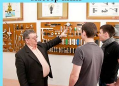
- Спецкабинет по профессии - - «Мастер ЖКХ» -