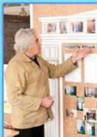
- Отделочная мастерская -