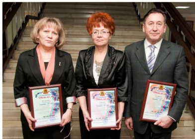
На конкурс «Ресурсосбережение» в этом году было

Образовательным учреждениям – победителям будут вручены премии на Губернаторском приеме «Рабочая смена Кузбасса»: I место – 500 тысяч рублей, II место – 350 тысяч рублей, III – 150 тысяч рублей.