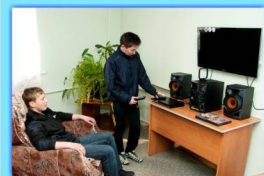
- В общежитии после занятий -