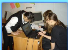
- Редакция газеты «Профи» -