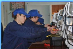
- В электромонтажной мастерской -

При лицее - уютное общежитие для ребят, где есть все условия для отдыха и самостоятельной подготовки.