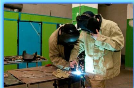
- Сварочная мастерская -