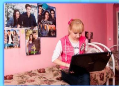
- В общежитии после занятий -