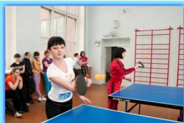
- В спортивном зале -